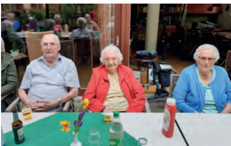
Satt und zufrieden.