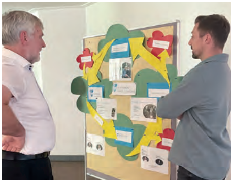
Im Gespräch mit dem Geschäftsführer.