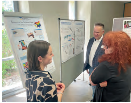
„Diversität“ und Schülerwohnbereich.

Auf einem bunten Marktplatz konnten die Führungskräfte Projekte und Aktivitäten der anderen Einrichtungen kennenlernen und Ideen für die eigene Arbeit mitnehmen. Die AGAPLESION MARKUS DIAKONIE präsentierte ihre Projekte Betriebliches Gesundheitsmanagement, Schülerwohnbereich, Seniorenlots:innen, Diversität, Tagesoase, den Einsatz digitaler Geräte und die anstehende Neuausrichtung im Hinblick der Personalbemessung. Die