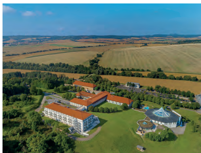
Idealer Tagungsort: Das Victor's Residenz Hotel.

trugen auch „Victor's Residenz-Hotel“, ein ehemaliges Kloster, mit seinem herrlichen Ausblick und die malerischen Sonnenuntergänge bei. Möchte man ein Resümee ziehen, kann man es mit dem Slogan der „HumorPille“ sagen: „Wir ziehen alle an einem Boot!“ Und das merkte man an diesen beiden Tagen! ●