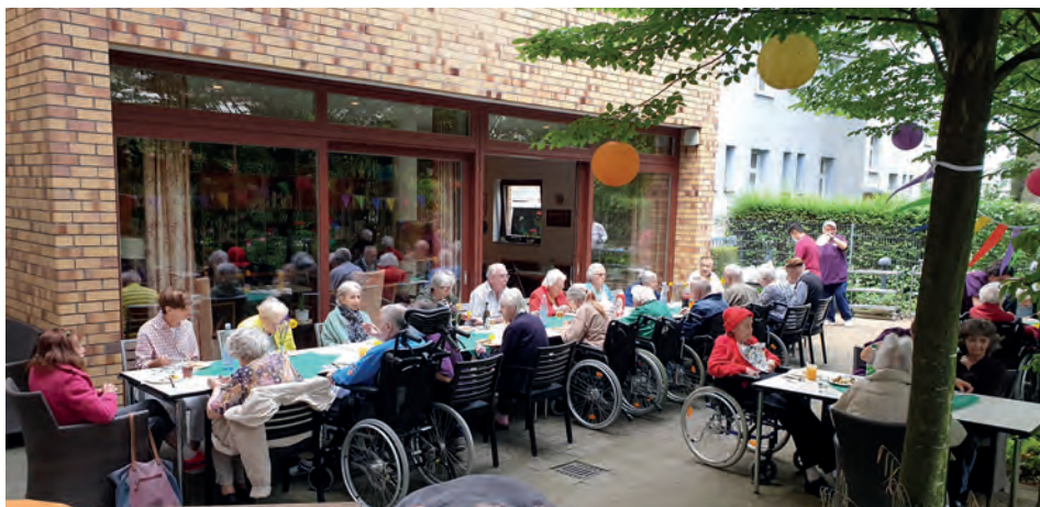
Die Tische sind gedeckt. Es fehlen nur noch die Bratwürste und Steaks.

Die Grillsaison in und mit den Wohnbereichen eröffnete am 7. und 8. Juni. Im Rosengarten des Haus Saalburg gab es Bratwürstchen und Steaks. Dazu durfte natürlich ein kühles Blondes nicht fehlen. Im Juli ging es mit den nächsten Grillterminen weiter. So schmeckt der Sommer doch am besten. ●