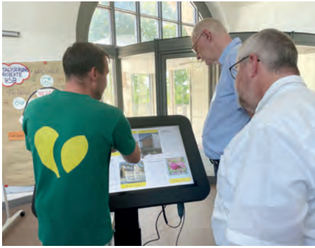
Bunter Marktplatz: Digitalisierung.