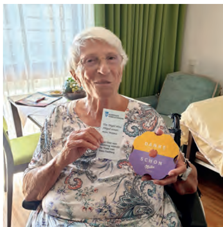
Anerkennung zum Muttertag.

„Mutti ist doch die Beste!“ Am Sonntag, den 8. Mai, war Muttertag. Als kleines Dankeschön gab es für alle Mütter im Haus eine Karte sowie ein Schokoladenpräsent. ●