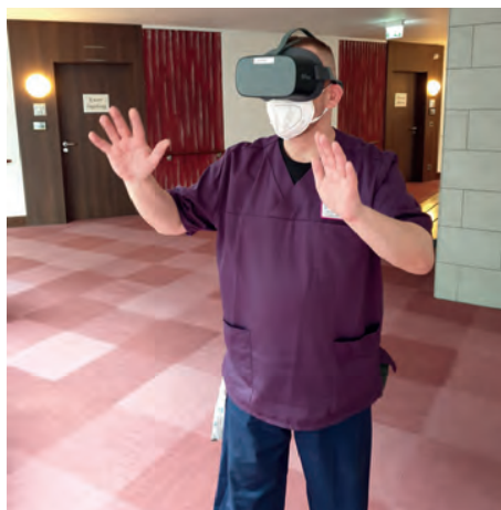
Auch ein Pfleger ging virtuell spazieren.

alles kann einfach und bequem – virtuell – besucht werden. Und dies sind alle Orte, an denen die meisten unserer Bewohner:innen auch schon persönlich waren. So werden alte Erinnerungen geweckt und neue Sinnes-Impulse gesetzt. Wenn wir, durch viele Corona-Beschränkungen, schon nicht rauskommen, dann holen wir einfach die Welt zu uns ins Haus. Sowohl Bewohner:innen als auch Mitarbeiter:innen hatten schon viel Spaß damit! So macht Technik wirklich Freude. ●