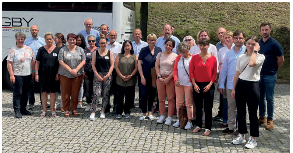
Die Führungskräfte aus Frankfurt, Darmstadt und Heidelberg waren gemeinsam nach Teistungen zur Konferenz angereist.