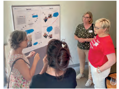
Betreuung in der Tagesoase.