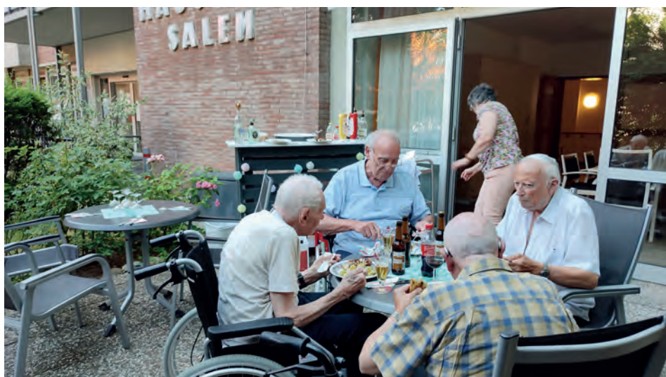
Männerstammtisch auf der Terrasse von Haus Salem.

Da das Wetter so schön mitspielte und der Gesprächsstoff nicht ausging, saßen wir bis in die Abendstunden hinein auf unserer Terrasse und genossen die untergehende Sonne. Es war eine rundum gelungene Veranstaltung. ●