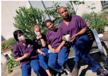
Ruhepause im Schwanthaler Carrée.

Am 12. Mai wird jedes Jahr weltweit der „Tag der Pflege“ begangen. Er soll auf die Bedeutung der professionellen Pflege aufmerksam machen und ist eine Gelegenheit, die Arbeit der Pflegenden zu würdigen.