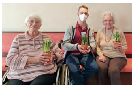
Blumen zum Weltfrauentag.

Fast schon eine kleine Tradition sind Blumen am Weltfrauentag im Haus Saalburg. So gab es dieses Jahr keine einzelne Rose, sondern ein kleines frühlingshaftes Blumentöpfchen. Dieses wurde an alle Damen im Pflegebereich sowie im Service Wohnen verteilt. Schon Johann von Goethe hatte den passenden Spruch hierzu: „Blumen sind die schönsten Worte der Natur.“ Da schließen wir uns gerne an. ●