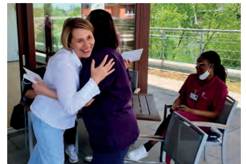
Beglückwünschung in Haus Saalburg.

Die Geschäftsführung und ihr Leitungsteam hatten sich für diesen Tag noch ein ganz besonderes Präsent ausgedacht: Jeder erhielt einen Gutschein für die frisch geprägte Zehn-Euro-Sammlermünze „Pflege“. „Die Sondermünze stellt die Arbeit der Pflegenden in den Fokus, die wir als Gesellschaft und als Anbieterin von Gesundheits- und Pflegedienstleis-