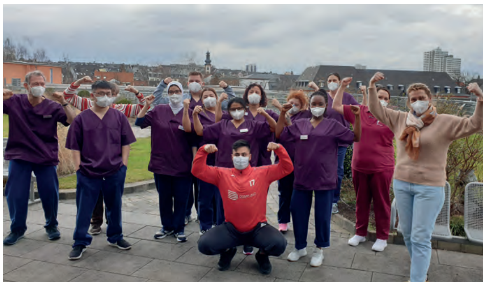
Teilnehmende eines BGF-Kurses.

Für die Qualifizierung unserer Mitarbeiter:innen gibt es einen Grundkurs im Umgang mit demenziell veränderten Menschen nach Böhm und