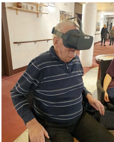
„Raus ins Grüne“ dank neuester Technik.

Dank einer Spende des Vereins „Lebensherbst e.V.“ haben wir eine nagelneue Virtual Reality Brille bekommen. Ob ein Spaziergang über den Frankfurter Römer, ein grandioser Ausblick vom Maintower oder eine Seilbahnfahrt in Rüdesheim,