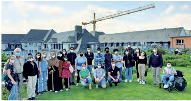
20 Jugendliche informierten sich über den Pflegeberuf.

Neben interessanten Vorträgen der Praxisanleiter:innen, der Pflegedienstleitung sowie der Leitung der Sozialen Betreuung konnten die Teilnehmer:innen auch einmal den Alterssimulationsanzug sowie den neuen Care Table ausprobieren. Am Ende des Tages hatten sie noch