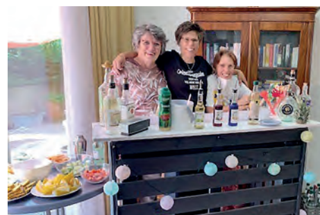
Barmixerinnen der sozialen Betreuung.

Eine Woche, nachdem die männlichen Bewohner zu einem vergnüglichen Stammtisch zusammengekommen waren, trafen sich auch die Damen allein in fröhlicher Runde.