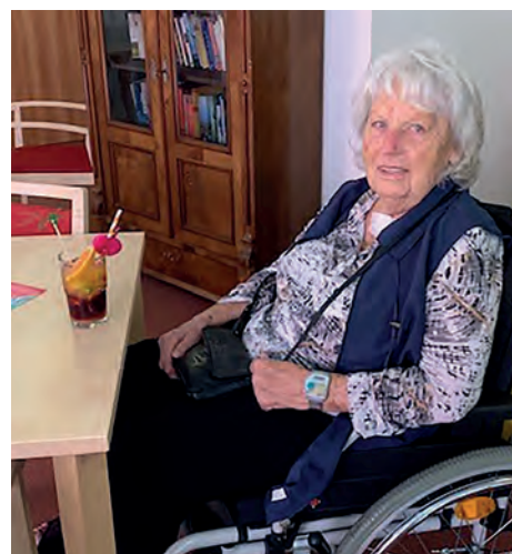
Eine Bewohnerin genießt ihren Cocktail.

Sie kosteten während eines Cocktail-Nachmittags verschiedene Mix-Getränke mit und ohne Alkohol, auch Sonderwünsche wurden erfüllt – wie z. B. ein Regenbogencocktail. Es hat den Damen gut geschmeckt und viel Spaß gemacht. ●