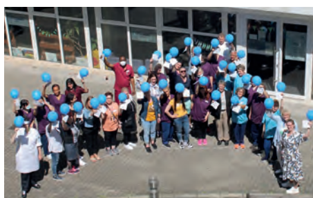
Freude im Oberin Martha Keller Haus.

Die Geschäftsführerin ließ es sich nicht nehmen, an diesem Tag alle drei Standorte der AGAPLESION MARKUS DIAKONIE zu besuchen. Gefeiert wurde mit Gegrilltem im Oberin Martha Keller Haus und im Schwanthaler Carrée sowie hausgemachten Crêpes im Haus Saalburg. Die Projektgruppen des betrieblichen Gesundheitsmanagements im Oberin Martha Keller Haus und