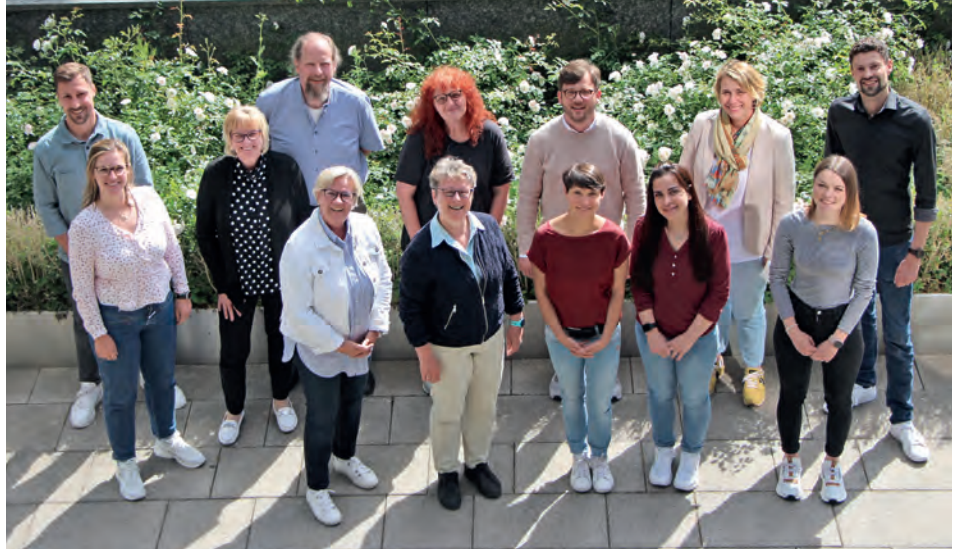
Teilnehmende des Strategie-Workshops.

Die Entwicklung einer gemeinsa- men Strategie zu „Gesund Arbei- ten“ und die Fokussierung auf die Zufriedenheit der Mitarbeiter:innen prägten die Diskussionen. Dies ge- schah ganz im Sinne des Leitbilds von AGAPLESION, das in seiner Vision christliche Nächstenliebe erlebbar machen möchte, indem es – neben den Bewohner:innen – die Mitarbeiter:innen in den Mit- telpunkt stellt, die mit ihren beson- deren Expertisen und Empathie das Miteinander prägen und mit großen Ambitionen arbeiten.