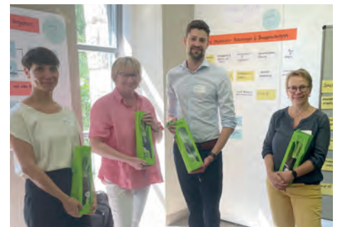
Dankeschön für die Standbetreuenden.

pflügen und die wertschätzende Kultur im gemeinsamen Umgang zu spüren: So wurden die beiden Tage von geistlichen Impulsen und Dankesworten der Geschäftsführer:innen begleitet, langjährige Mitarbeiter:innen geehrt und auch in den Ruhestand verabschiedet.