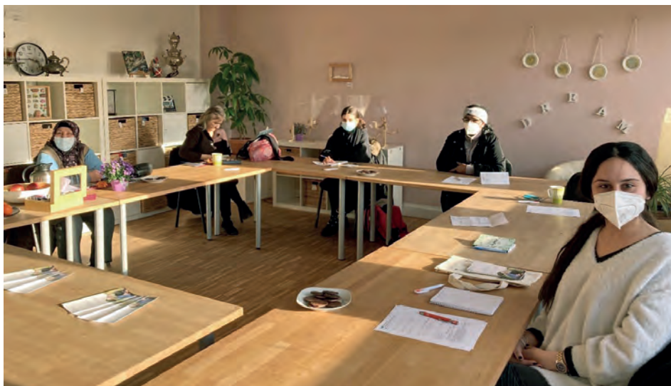
Gesprächsrunde in den Räumen von „infrac e.V.“.