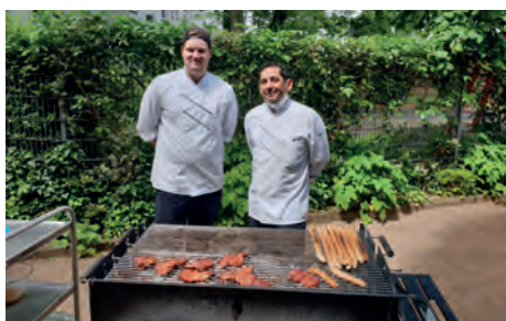
Die „Grillmeister“ vom Henricus.